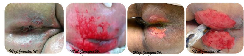
ลักษณะแผลที่มีความรุนแรงระดับที่ 2 (IAD category 2)