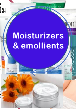
Moisturizers & emollients